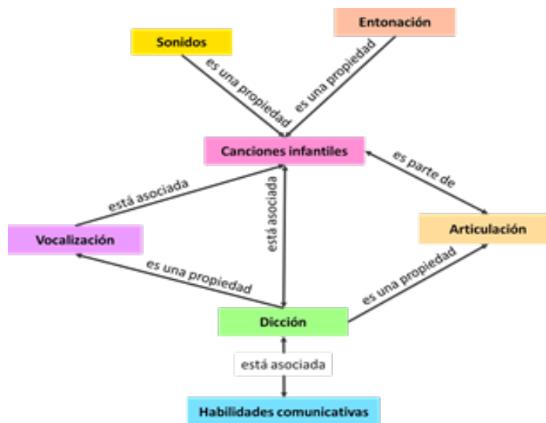
Figura 3. Red semántica vinculación de las categorías de investigación.

Una vez que se estudiaron ambas categorías por separado se realizó un análisis general que permitió establecer sus relaciones y destacar la relevancia de las canciones infantiles para desarrollar la dicción, lo cual se grafica en la figura 3.