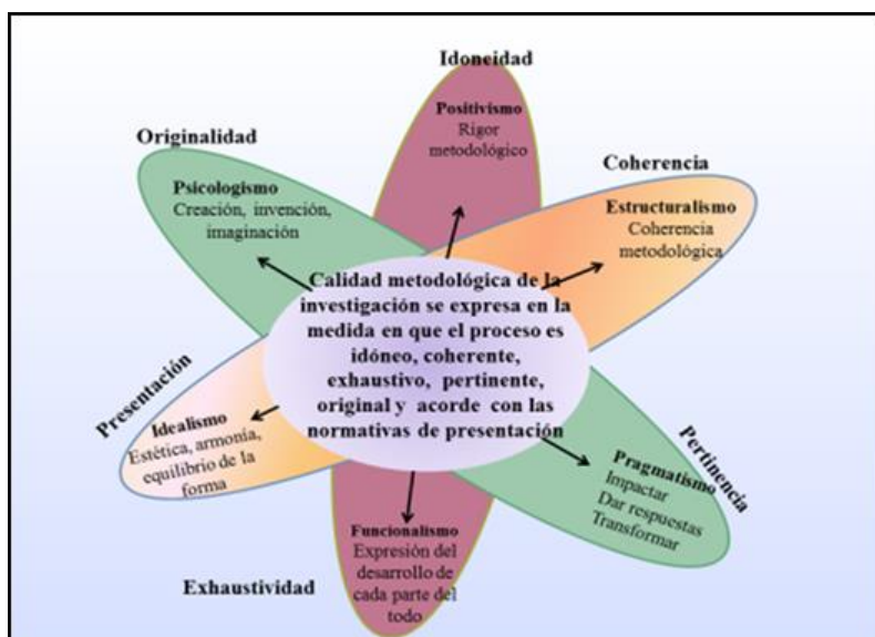
Figura 1. Representación de las relaciones paradigmáticas y el núcleo sintagmático en una definición integrada de calidad metodológica.

En la fundamentación de la Matriz para el Análisis Integral de Trabajos de Investigación (Maiti) se asumen sintagmáticamente las contribuciones de cada perspectiva sobre la calidad metodológica que subyace en algunos modelos epistémicos. Desde una interpretación sintagmática, es posible caracterizar y apreciar de manera integrada la calidad metodológica de la investigación, como un holos comprendido dentro de su dinámica como un proceso idóneo, correcto y adecuado, con un desarrollo coherente y exhaustivo de los elementos correspondientes a las fases operativas, pertinente a las necesidades contextuales, distinguido por rasgos de originalidad y acorde con las normativas de presentación, según las exigencias del ámbito donde se realice. Las relaciones paradigmáticas que dan origen a esta comprensión se representan en la figura 1.