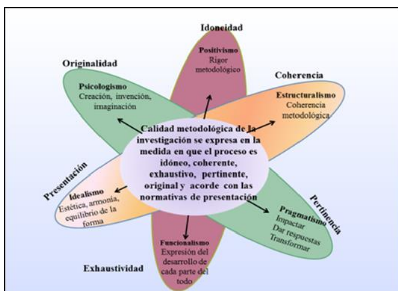
Figura 1. Representación de las relaciones paradigmáticas y el núcleo sintagmático en una definición integrada de calidad metodológica. (Fuente: Vicuña (2004). Manual para el análisis integral de investigaciones. Ciea.)

En la fundamentación de la Matriz para el Análisis Integral de Trabajos de Investigación (Maiti) se asumen sintagmáticamente las contribuciones de cada perspectiva sobre la calidad metodológica que subyace en algunos modelos epistémicos. Desde una interpretación sintagmática, es posible caracterizar y apreciar de manera integrada la calidad metodológica de la investigación, como un holos comprendido dentro de su dinámica como un proceso idóneo, correcto y adecuado, con un desarrollo coherente y exhaustivo de los elementos correspondientes a las fases operativas, pertinente a las necesidades contextuales, distinguido por rasgos de originalidad y acorde con las normativas de presentación, según las exigencias del ámbito donde se realice. Las relaciones paradigmáticas que dan origen a esta comprensión se representan en la figura 1.